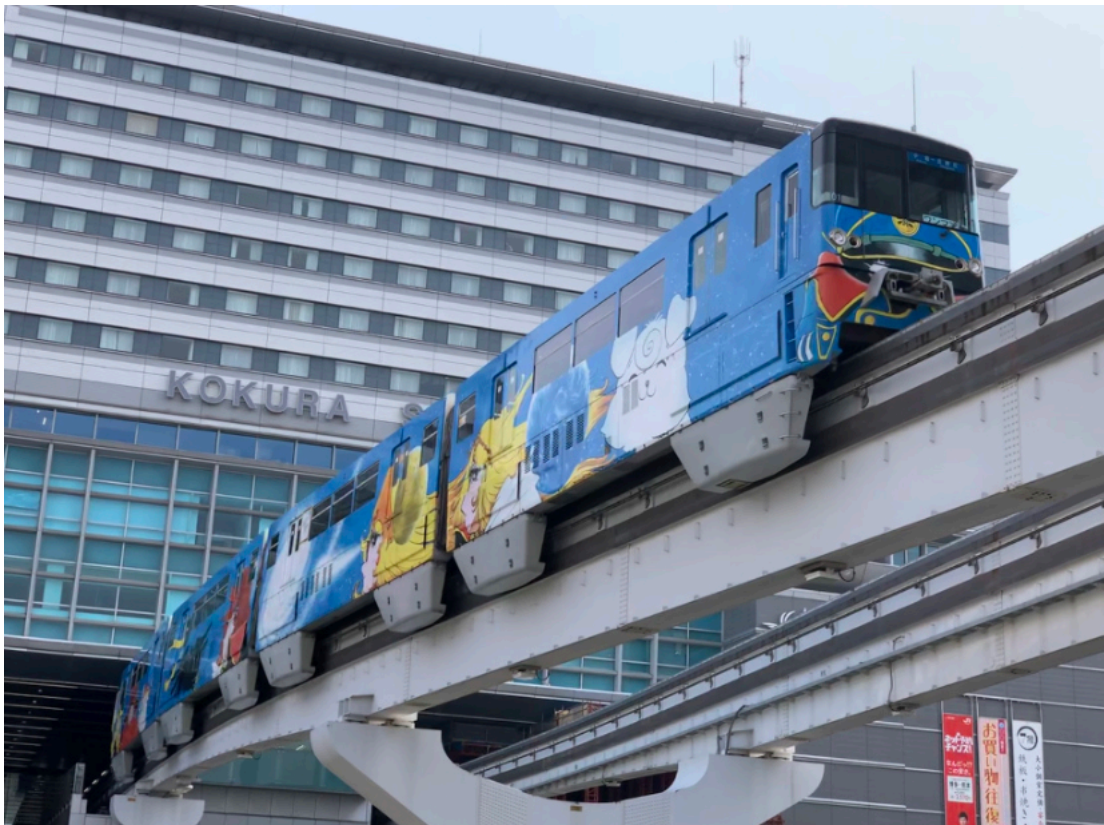
北九州高速鉄道小倉線 小倉駅付近