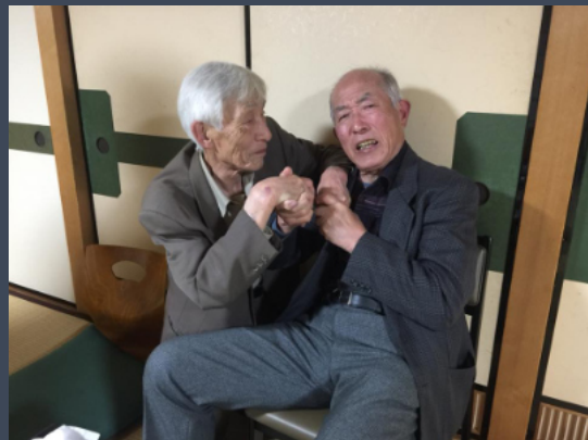
2018年5月12日 粟津温泉・かたやま緑華苑