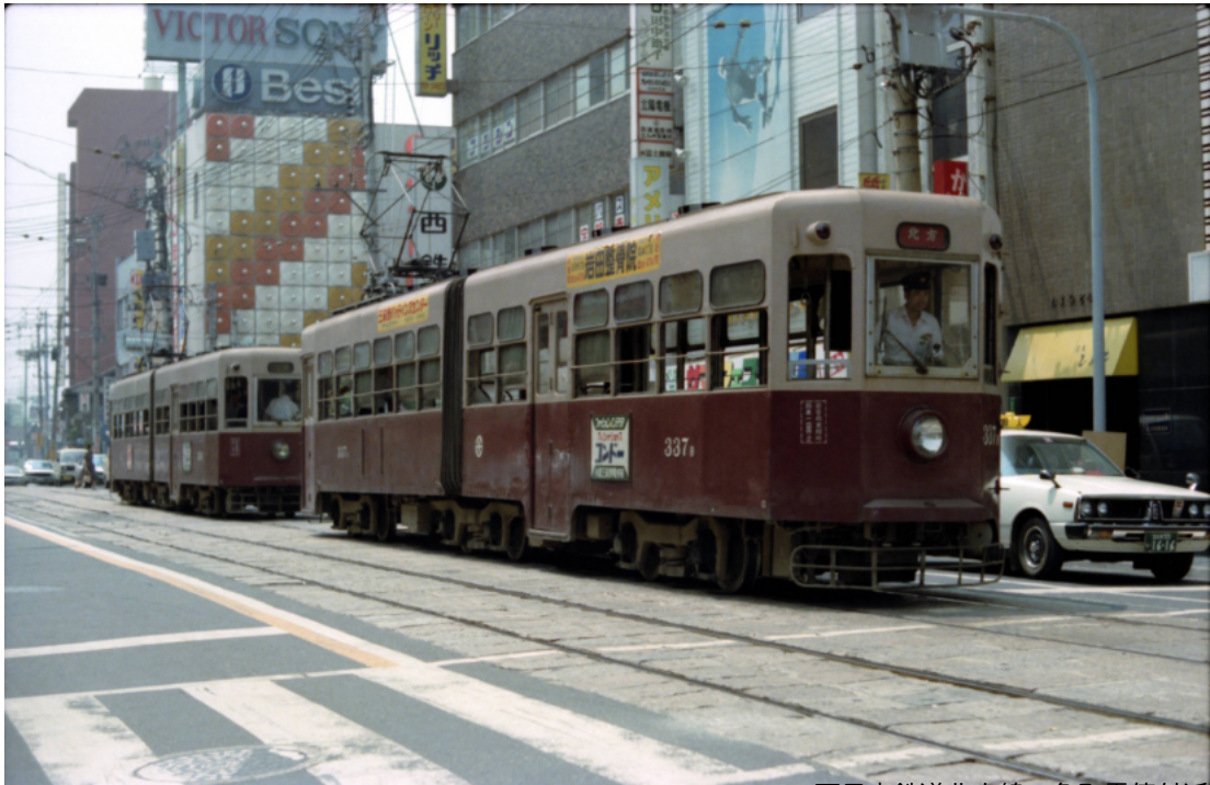
西日本鉄道北方線 魚町電停付近