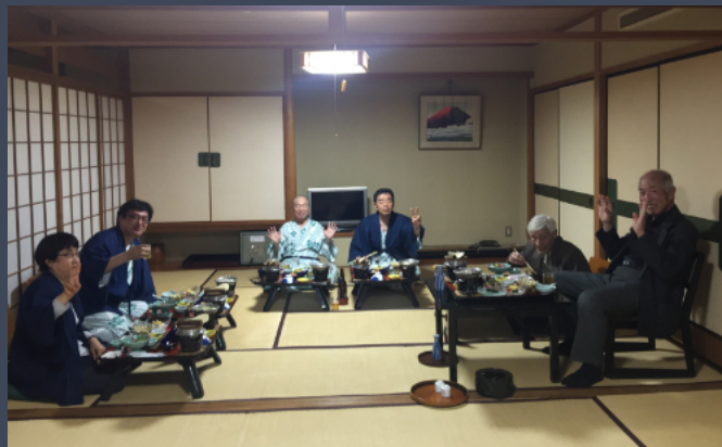
2018年度総会・懇親会