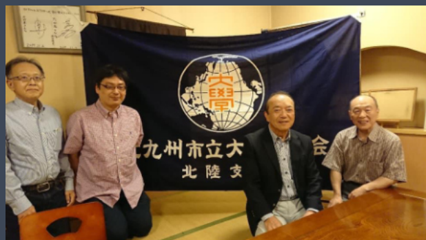
2019年5月18日 金沢市・たか木