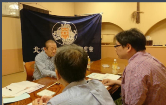
2019年度総会・懇親会